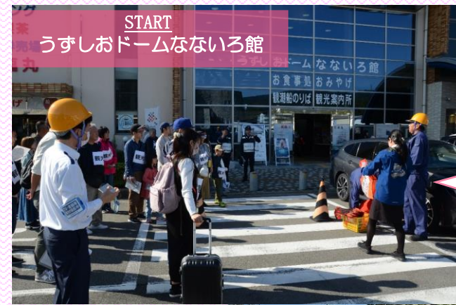
START うずしおドームなないろ館

福良観光の観光拠点であるうずしおドームなないろ館とその周辺。毎年多くの観光客が観潮船や淡路人形座を訪れています。今回、これらの観光施設による避難訓練が初めて開催されました。避難訓練では、実際に福良を訪れた観光客約 40 名や、地域の方々が参加されました。