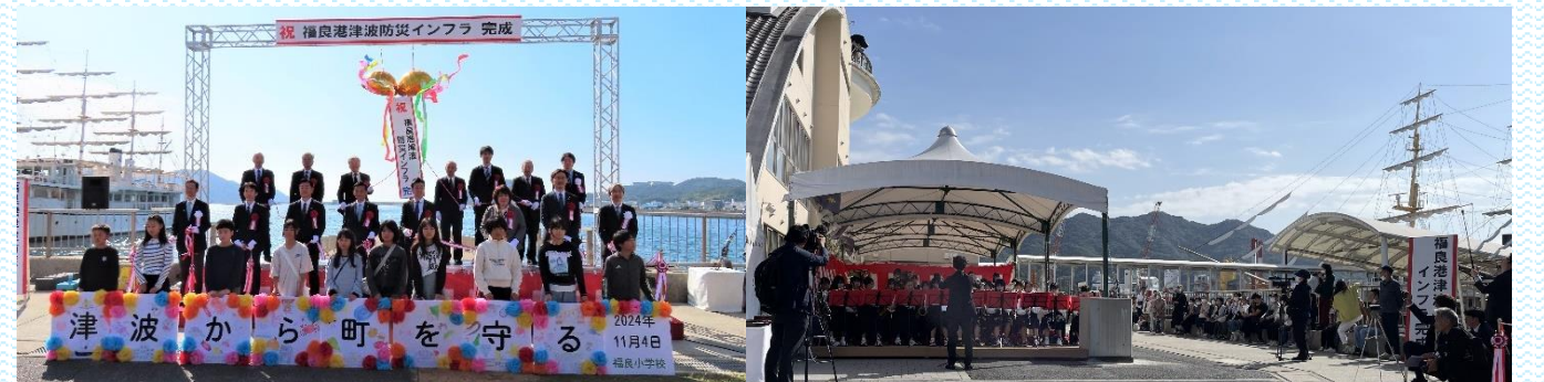
テープカット、くす玉開披、福良小学校によるパネル披露