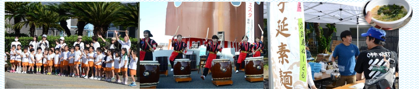
福良こども園園児による演技