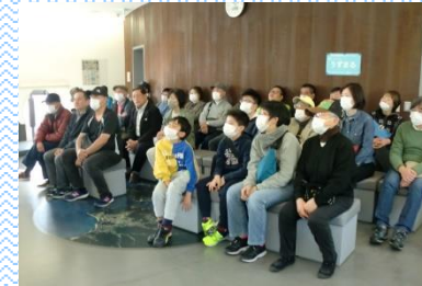
団体での来館も多く、様々な方に津波防災について学習・体験いただいています！