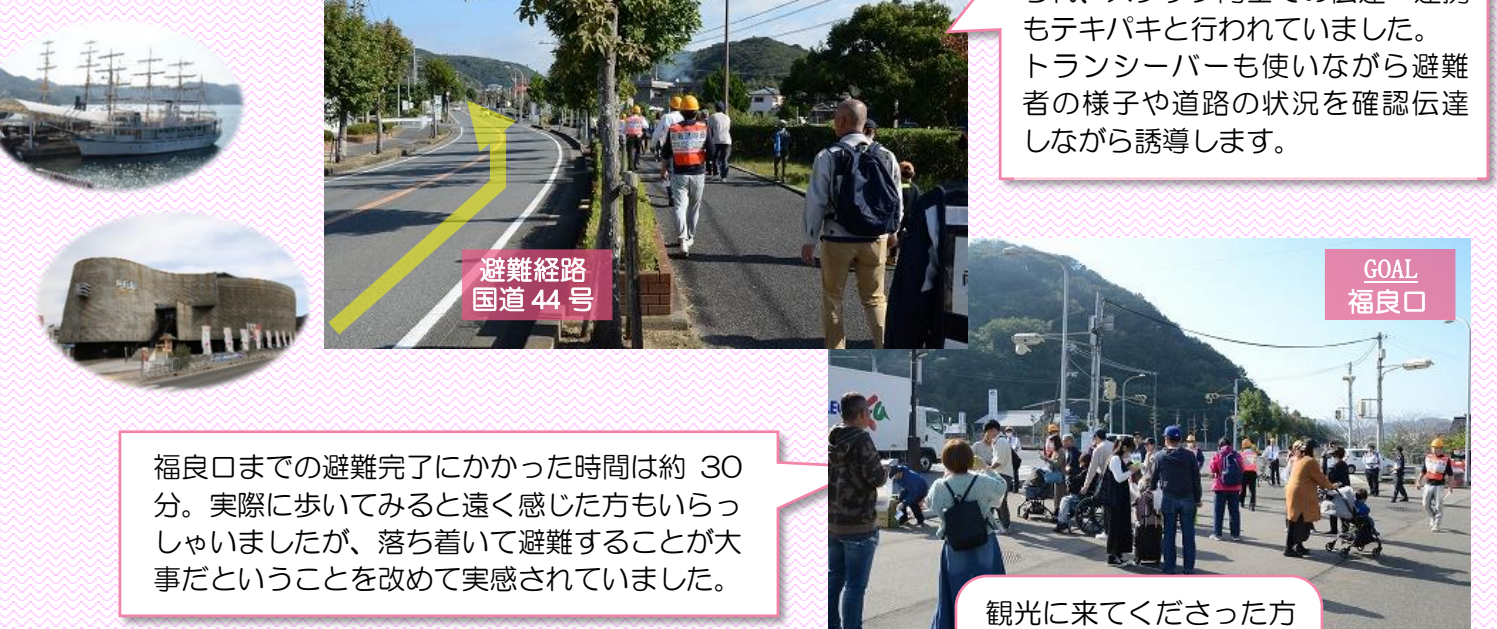
避難経路 国道 44 号

普段から避難訓練に力を入れておられ、スタッフ同士での伝達・連携もテキパキと行われていました。トランシーバーも使いながら避難者の様子や道路の状況を確認伝達しながら誘導します。